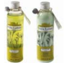
TRATTAMENTO QUOTIDIE Shampoo e Condizionante