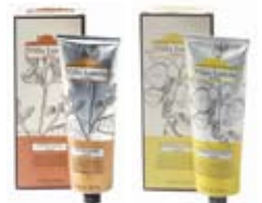
TRATTAMENTI ALL'ARGILLA: CUTIS SANA REMIUM SEBI

SCOPRI I PRODOTTI CON L'ESPERTO NELLA SERATA NATURALE CON APERITIVO BIOLOGICO: