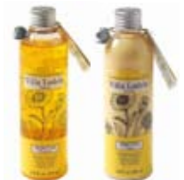
TRATTAMENTO SERICUM Shampoo e Condizionante