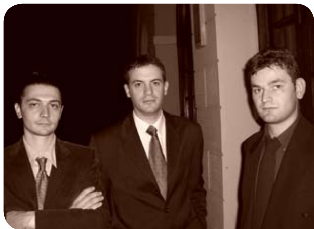
Sonora Club Electro in Fisa, 2008

L'ascolto di alcuni brani è disponibile sul loro web space www.myspace.com/sonoraclub .