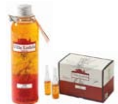
TRATTAMENTO VIS Shampoo e Lozione